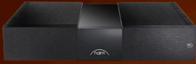
Naim New Classic