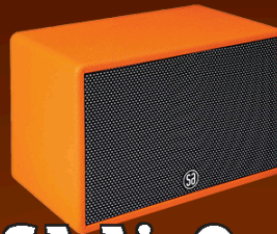
SA Air One